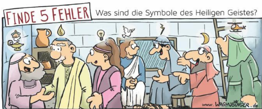
Flaschengeist, Glühbirne, Blitz, Mond, Hubschrauber

Und so wirkt der Heilige Geist auch noch heute. Er ist die Kraft, die Gott uns für das Leben schenkt: Wenn wir ängstlich sind und Sorgen haben, wenn wir einsam sind und uns alleine fühlen, wenn wir traurig sind. Dann hilft uns Gott durch den Heiligen Geist. Er ist die Kraft seiner Liebe.